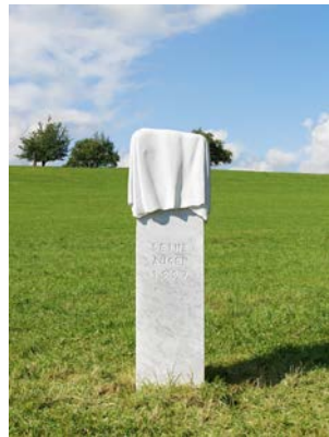
Ragnar Kjartansson Denkmal , 2011 Carrara-Marmor 3 Teile: je 180 x 45 x 45 cm