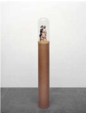
Thomas Schütte Ohne Titel (3 Skulpturen aus der Serie United Enemies ), 1994-1995 Fimo, Stoff, Hanfschnur, Plastikklebeband, Glas, Holz, PVC Je 191 x 26 x 26 cm

MIGROS MUSEUM FÜR GEGENWARTSKUNST LIMMATSTRASSE 270 POSTFACH 1766 CH-8005 ZÜRICH