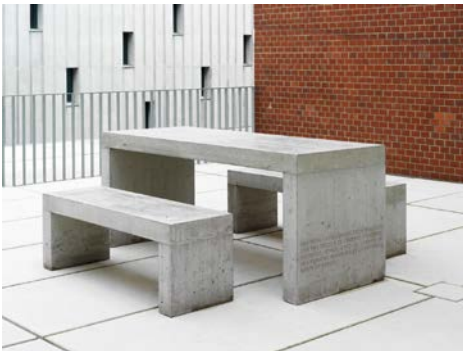
Teresa Margolles Mesa y dos bancos , 2013 Hergestellt aus einer Mischung aus Zement und vom Boden aufgehobenem Material, auf dem der Körper einer an der nordmexikanischen Grenze ermordeten Person lag. Tisch: 85 x 80 x 200 cm, Bänke: je 50 x 45 x 140 cm