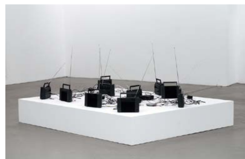
Mathilde ter Heijne 1, 2, 3, ...10, wie niet weg is, is gezien , 2000 10 Radios, 10 CD-Player, 1 Zentralsteuerung Edition: 1 + 1 ap Ca. 70 x 220 x 200 cm

MIGROS MUSEUM FÜR GEGENWARTSKUNST LIMMATSTRASSE 270 POSTFACH 1766 CH-8005 ZÜRICH