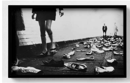
Marc Camille Chaimowicz Shoe Waste? , 1971/2005 Schwarzweissfotografie, Handabzug Silbergelatine Edition: 2/5 5 Teile: Grösse variabel