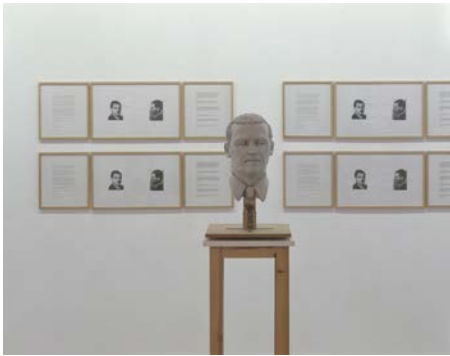
Christine Borland L'Homme Double , 1997 Lehm, Stahl, Holz, Acryl, gerahmte Dokumente Grösse variabel