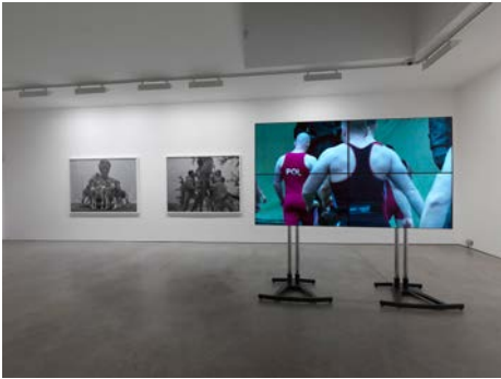
Christian Jankowski Heavy Weight History , 2013 1-Kanal-Video auf Monitor (Farbe, Ton), 3 s/w Fotografien, Silbergelatine auf Barytpapier, Tribüne Edition: 1/5 + 2 ap 25:46 min., Grösse variabel