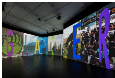
Glacier 2013 4-Kanal-Videoprojektion, synchronisiert (Farbe, Ton) Musik: Bruce Gilbert 12 Min.