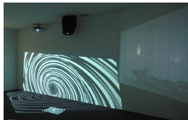
Institute for Turbulence Research 2008 5-Kanal-Videoinstallation: 4-Kanal-Videoprojektion, synchronisiert (Farbe, Ton), Voile-Leinwand und 1-Kanal-Videoprojektion mit Spiegeleinheit (Farbe, Ton) 6 Min.