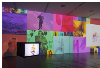
2003 2018 4-Kanal-Videoinstallation, synchronisiert: 2-Kanal-Videoprojektion (Farbe, Ton) und 2-Kanal-Video auf Monitor (Farbe, Ton) 36 Min.