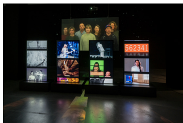
The Years 2018 6-Kanal-Videoinstallation: 4-Kanal-Video auf Monitor, synchronisiert (Farbe, Ton), Holzpodeste und 2-Kanal-Videoprojektion (Farbe, Ton), Rückprojek- tionsscheibe 18:55 Min.

MIGROS MUSEUM FÜR GEGENWARTSKUNST LIMMATSTRASSE 270 POSTFACH 1766 CH-8005 ZÜRICH